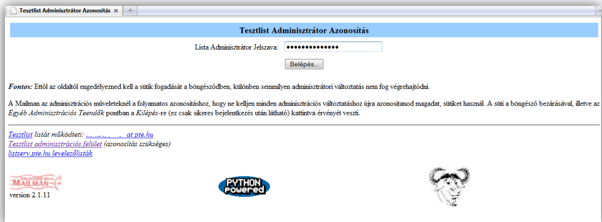
1. ábra - Bejelentkezés az adminisztrációs felületre

A felületre a lista adminisztrátor jelszavával lehet bejelentkezni melyet az igényléskor feltüntetett adminisztrátornak e-mail-ben kiküldtünk.